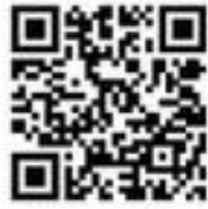
วิธีการสมัครเข้าศึกษา

1. การสมัครสอบทางออนไลน์ www.socadmin.tu.ac.th หรือ เข้าโดยตรงที่ http://gradreg.innovtalk.com/home_grad_register_social_work.php ตั้งแต่วันที่ 1 กรกฎาคม 2567